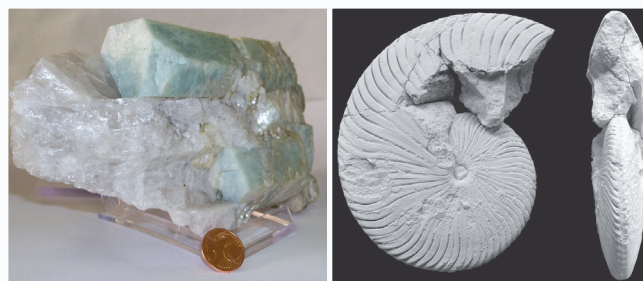
Collezioni mineralogica e paleontologica

Il trasferimento di conoscenze non si limita all'ambito accademico: il Centro sviluppa collaborazioni e partenariati con enti pubblici, imprese e privati, i quali possono beneficiare della rete di competenze interdisciplinari presenti nel Centro e fruire dei servizi di ricerca, sviluppo e analisi offerti dalle strutture afferenti.