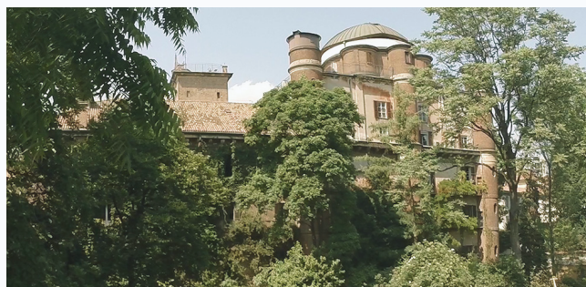
Orto Botanico di Brera

Il Centro sviluppa e promuove attività di valorizzazione del patrimonio culturale anche attraverso attività di conservazione e divulgazione di alcune collezioni di cui l'Università ha la proprietà o la gestione, che includono edifici storici e un ingente patrimonio artistico, librario, archivistico, naturalistico e strumentale.